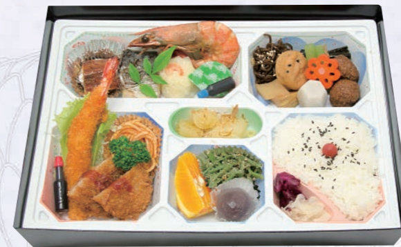
66 会席パック料理(竹) 3,300円(税込) 【サイズ】W36×H26(cm)