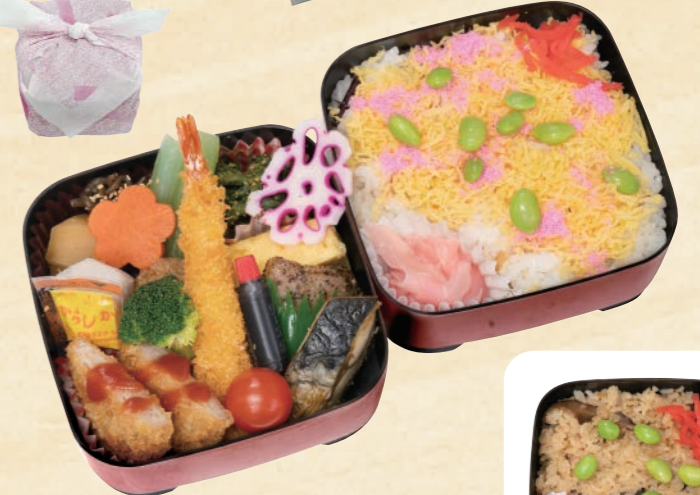
43 重箱入り二段弁当(ちらし寿司) 1,944円(税込) 【サイズ】W12×H12 (cm)