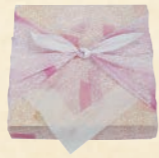
37 しらゆり 2,376円(税込) 【サイズ】W21×H15 (cm)

鶏そぼろ丼、ローストビーフ丼の2種類の味と三ヶ日牛焼肉、豚しゃぶ、緑黄色野菜グリルをお楽しみください。