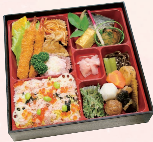
60 松花堂弁当(泉) 2,750円(税込) 【サイズ】W24×H24(cm)