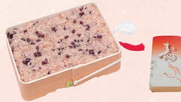
64 折箱入り赤飯(600g) 1,200円(税込) 【サイズ】W22×H15.5(cm)