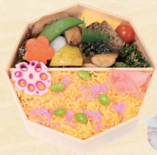
42 彩りちらし寿司弁当 1,404円(税込) 【サイズ】W17×H15.5 (cm)

9種類の野菜が入ったちらし寿司。見た目にも可愛い八角形の器に彩りよく盛り付けされたお弁当をお楽しみください。