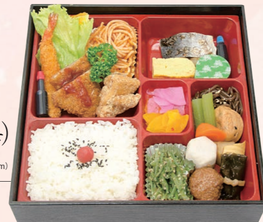
63 松花堂弁当(梅) 1,500円(税込) 【サイズ】W24×H24(cm)