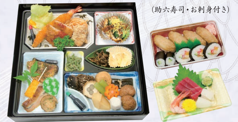
67 会席パック料理(松) 4,500円(税込) 【サイズ】W31×H31(cm)