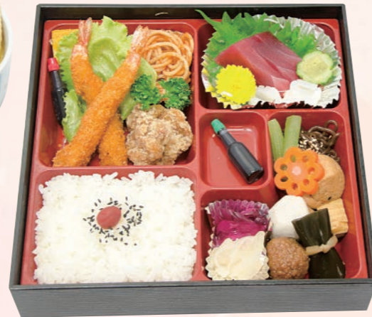
61 松花堂弁当(竹) 2,750円(税込) 【サイズ】W24×H24(cm)