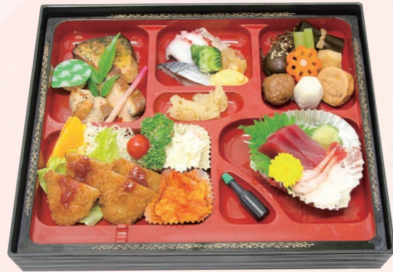
58 特選松花堂(竹) 3,500円(税込) 【サイズ】W36×H29(cm)

四季折々の食材を取り入れた松花堂弁当。 会社会議、会合など大切なお客様へのおもてなしにご利用ください。