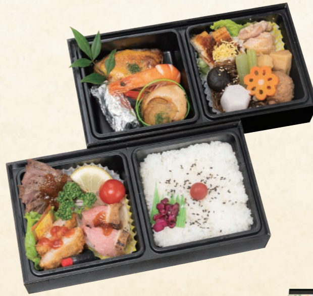
40 特選二段重(竹) 3,850円(税込) 【サイズ】W26×H13 (cm)

壹の段は牛ステーキ、ローストビーフ、ひれかつなどの洋風。貳の段はプリの黄身焼き、うざく、煮物などの和風です。和洋折衷の豪華二段重のお弁当をお楽しみください