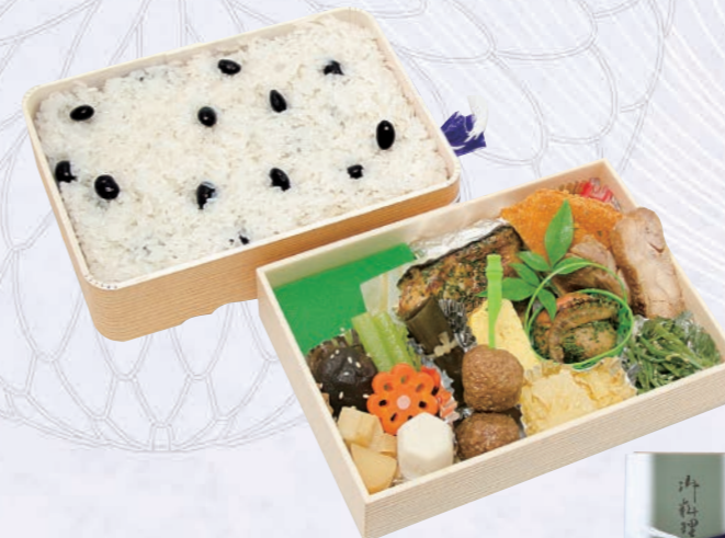
68 精進弁当 4,000円(税込) 【サイズ】W22×H15.5×8(高さ)(cm)