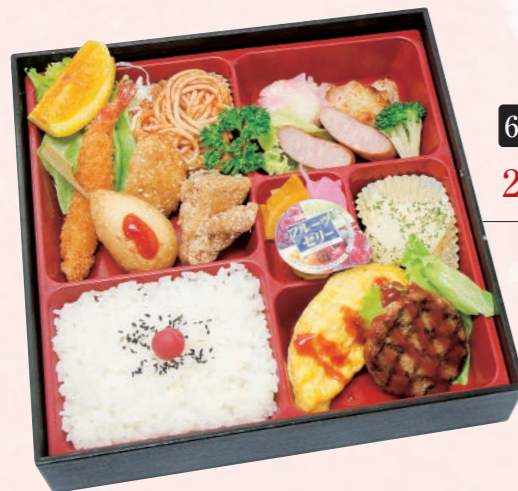
62 松花堂弁当(華) 2,000円(税込) 【サイズ】W24×H24(cm)