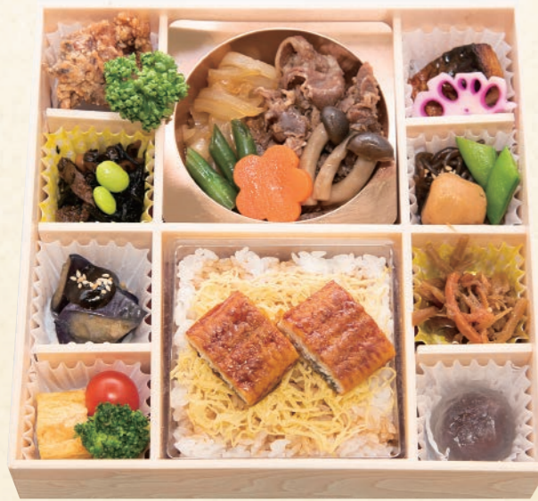
36 特選牛すき膳 【サイズ】W21×H21 (cm)

食材や華やかさにこだわったお弁当。 晴れの日の大切なお客様へのおもてなしにお薦めです。