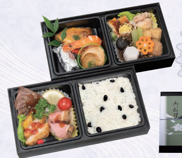
69 特選二段重(黒おこわ) 4,000円(税込) 【サイズ】W26×H13(cm)