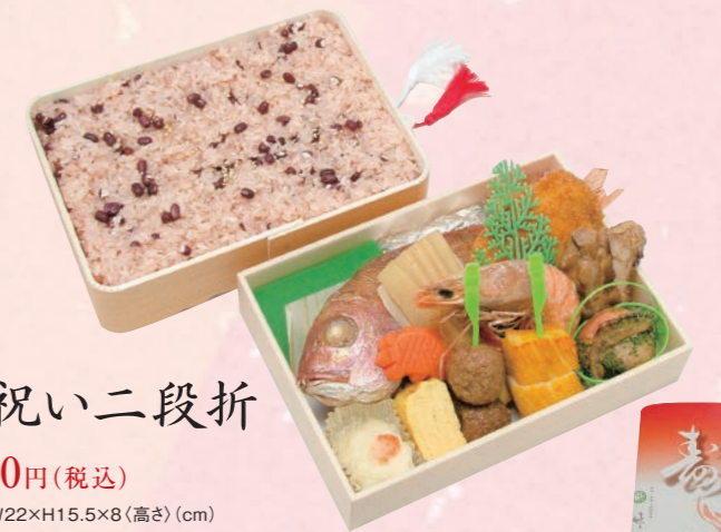
65 祝い二段折 4,000円(税込) 【サイズ】W22×H15.5×8(高さ)(cm)