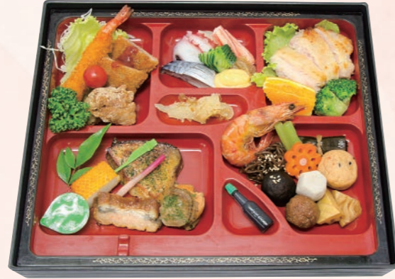
59 特選松花堂(松) 4,500円(税込) 【サイズ】W36×H29(cm)