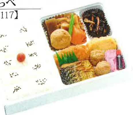
あじ 味くらべ 【No.1117】