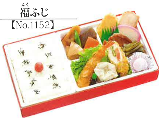
ふく 福ふじ 【No.1152】

お洒落な折に詰めた、目にも華やかなご馳走弁当。女性の方や、おもてなし用に好評です。 季節によりご飯が変わります。◎お届けは、午前10時以降となります。