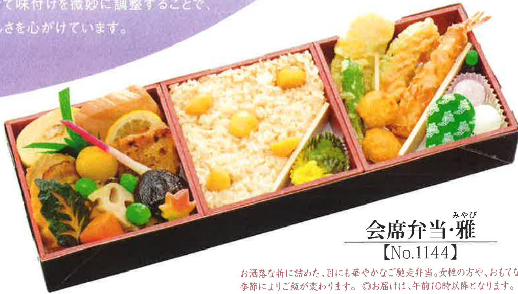
みやび 会席弁当・雅 【No.1144】

夏と冬では、湿度や温度、 お召し上がりいただく状況など、 季節によってかなり差があるもの。 そこで、お弁当づくりの長年の経験から、 時節に合わせて味付けを微妙に調整することで、 ベストなおいしさを心がけています。