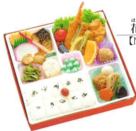
はな 花ごよみ 【No.1113】