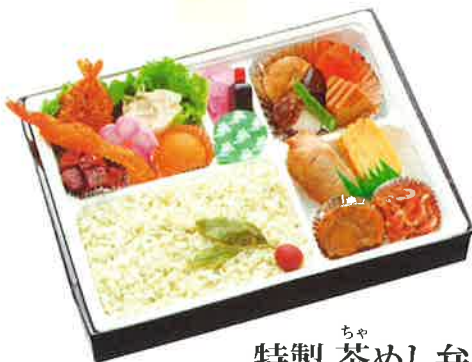
ちゃ 特製 茶めし弁当

醤油ごはんには鯛のおぼろをまぶした 「元祖鯛めし」に煮物のおかずがついた 人気のお弁当。