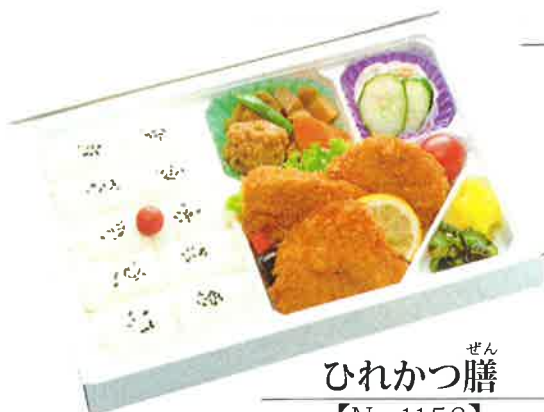
ぜん ひれかつ膳 【No.1156】