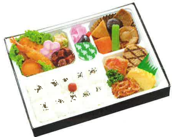
特製 幕の内弁当・錦 【No.1102】