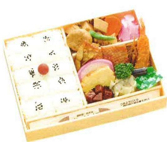
特製 幕の内弁当 【No.1101】