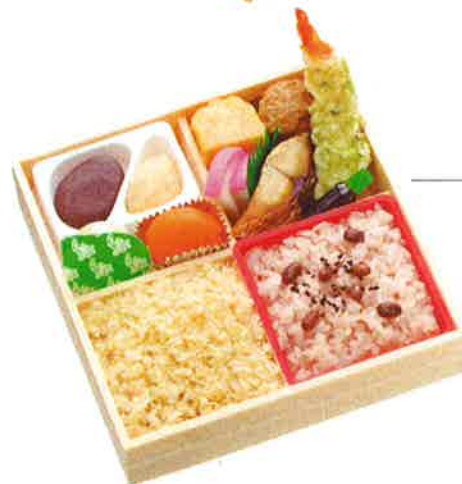
おおごしよ 大御所弁当