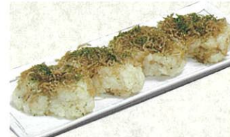
俵おこわ 遠州灘しらす 12個入 5,500円(税・送料・包装込)