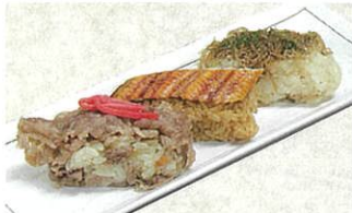
俵おこわ 三種の味くらべ 3種各4個入 7,700円(税・送料・包装込)