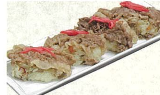
俵おこわ 三ヶ日牛 12個入 6,600円(税・送料・包装込)

●注文から発送まで1週間程度かかります。●クール宅急便でのお届けとなります。●消費期限は冷凍で2ヶ月となります。●ギフト包装・のしにも対応致します。