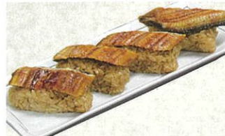
俵おこわ 浜名湖うなぎ 12個入 11,000円(税・送料・包装込)